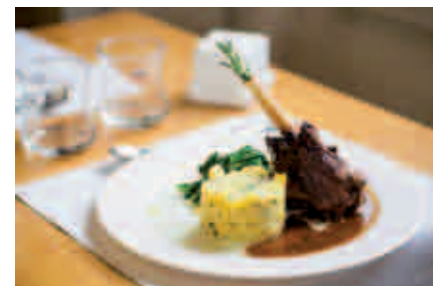
📷 archiv restaurace TXT redakce