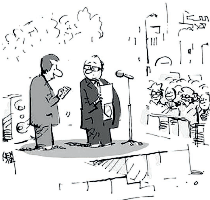
JEDEN CHYTREJ VOLIČ VYJDE NA MOC PENĚZ ZA TY SAMÝ PRACHY MŮŽETE MÍT 500 HLOUPEJCH...