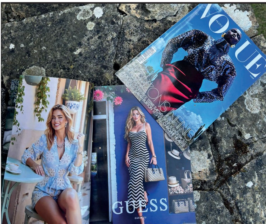
Studio se nedávno dostalo do titulků díky své kampani pro společnost Guess vytvořené pomocí umělé inteligence, která byla představena v časopise Vogue.